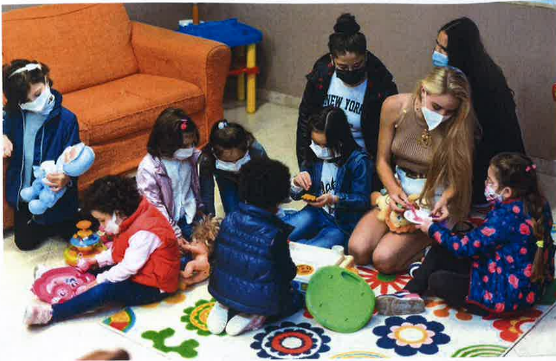
La princesse Maria Carolina avec les enfants de la Casa del Sorriso de Monreale. Cette structure de séjour accueille des enfants qui ne peuvent plus être pris en charge par leurs parents. Elle est soutenue par la famille de la princesse depuis des années.