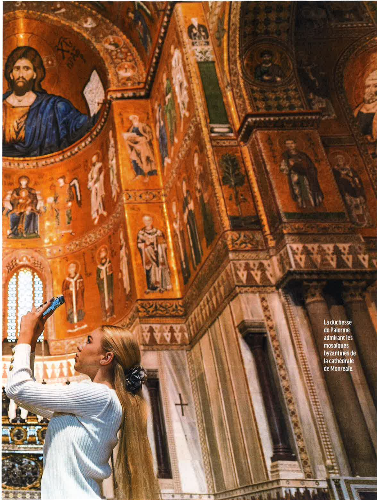
La duchesse de Palerme admirant les mosaïques byzantines de la cathédrale de Monreale.