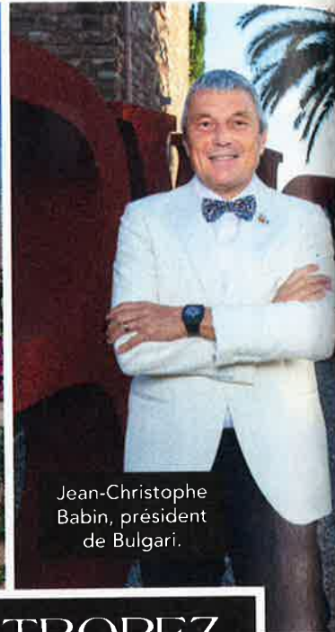
Jean-Christophe Babin, président de Bulgari.