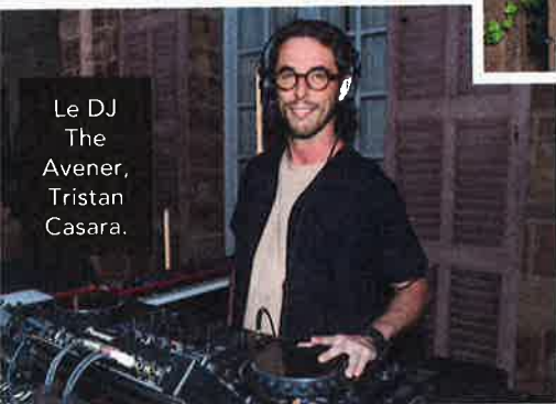
Le DJ The Avener, Tristan Casara.