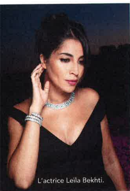
L'actrice Leïla Bekhti.