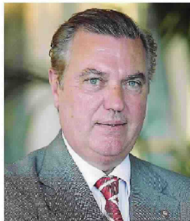
Il principe Carlo di Borbone